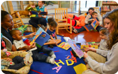
የቤተሰብ መገልገያ ማዕከላት