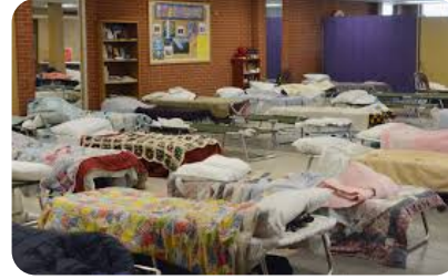
የጊዜያዊ መጠለያ ድጋፍ