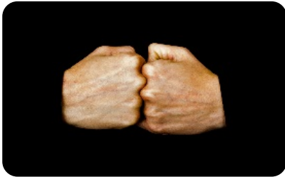
የቤት ውስጥ ጥቃት/ በደል ለደረሰባቸው የሚሰጥ እርዳታ