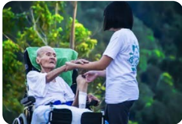
በሞት አፋፍ ላይ ለሚገኙ ህመማን የሚደረግ ድጋፍ