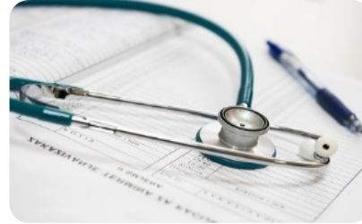
የነቫዳ ጤና አገናኝ መስሪያ ቤቶች