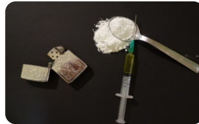
ለአደንዛኝ ዕፅ ሱስ ተጠቂዎች የሚሰጥ ድጋፍ