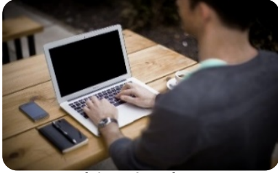
ሥራ የማስቀጠር እና የስልጠና ድጋፍ