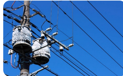
የሙብራትና ውሃ ክፍያ ድጋፍ