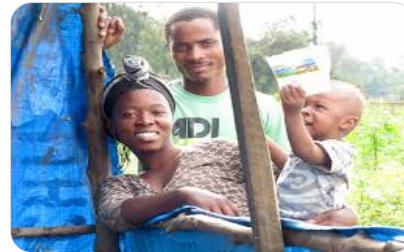
ልጅ የማሳደግ ድጋፍ