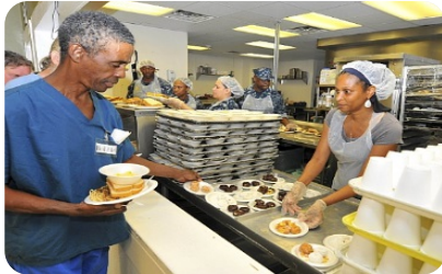
ለጎዳና ተዳዳሪዎች የሚሰጡ አገልግሎቶች