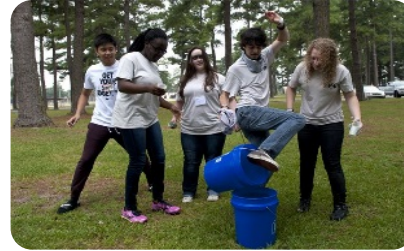
ለታዳጊዎች የሚሰጡ አገልግሎቶች