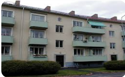
የቤት እና የኪራይ ድጋፍ